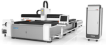
PLATE & TUBE EXCHANGE PLATFORM INTEGRATED FIBER LASER CUTTING MACHINE